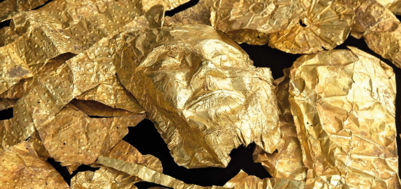
Goldobjekte aus der Raubgrabung eines Friedhofs bei Thessaloniki, 2011 konfisziert.