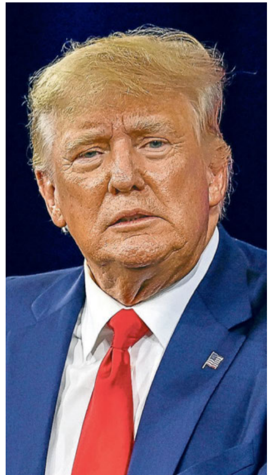
Schwerwiegend: Donald Trump wird wegen versuchter Wahlbeeinflussung angeklagt.

1 Polizeibeamter stirbt zwei Tage später an seinen Verletzungen