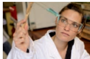
In educating its students and advancing outstanding young researchers, Heidelberg University emphasises research-based teaching.