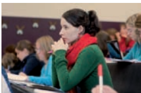
Approx. 30,000 young people study at Heidelberg University.